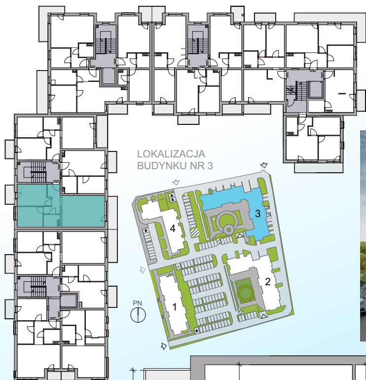
LOKALIZACJA BUDYNKU NR 3