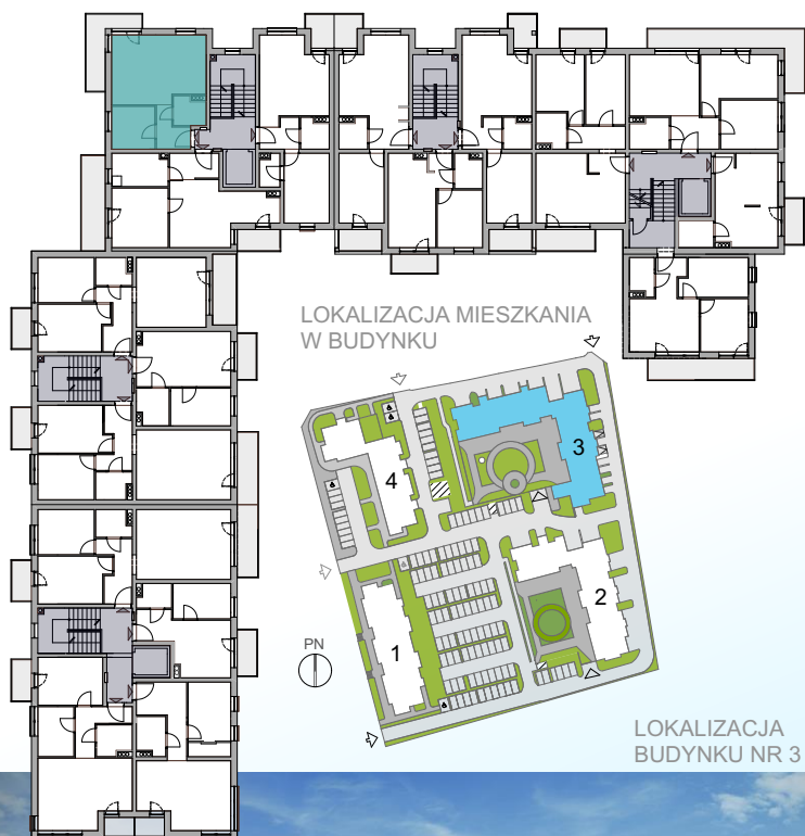
LOKALIZACJA MIESZKANIA W BUDYNKU