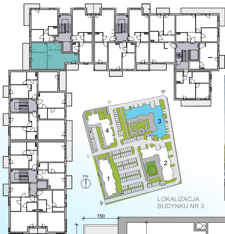
LOKALIZACJA BUDYNKU NR 3